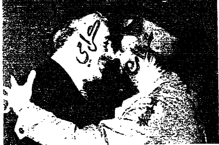
لقاء بين عرفات وكرامي

من يوقف القتال على حدود التتسيم؟ الرئيس كرامي قد يكون بحاجة الى حيلة ذكية تضم بريجنيف وغورد وجيسكار ديستان والبابا بولس السادس وعدد من رؤساء الدول في المنطقة ، اكثر مما هو بحاجة الى الهيئة التي يبدو ان حل قضية فلسطين اسهل من اجرائها ، والبعض يقول انه في الواقع يهجم الى الرئيس فرنجة والسيد باشر عرفات ، او الى الرئيس فرنجة فقط ، وربما كان بحاجة الى رئيس جديد ، او الى نفسه قبل كل شيء .